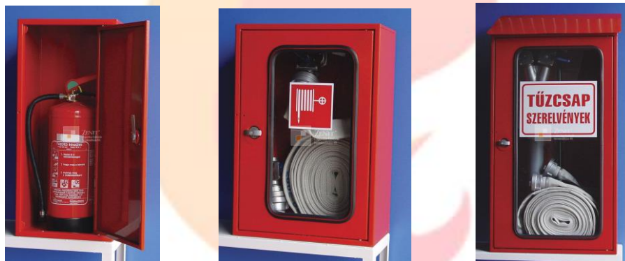
3. kép Kézi tűzoltó készülék, Fali tűzcsap, Tűzcsap szerelvények.

Ha a tűz nagysága, hozzáférhetősége, veszélyessége engedi, és tűzoltó készülék, fali tűzcsap vagy tűzcsap szerelvények (3. kép) rendelkezésre állnak, kezdjük meg azoknak a használatát a tűzoltás, és az életveszély elhárítása érdekében.