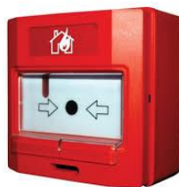
1. kép Kézi jelzésadó.

Amennyiben beépített tűzjelző rendszer van telepítve, és az a tűz észlelésének időpontjában nem ad riasztási jelzést, a legközelebbi kézi jelzésadó aktiválásával ( 1. kép ) tűzjelzést kell indítani.