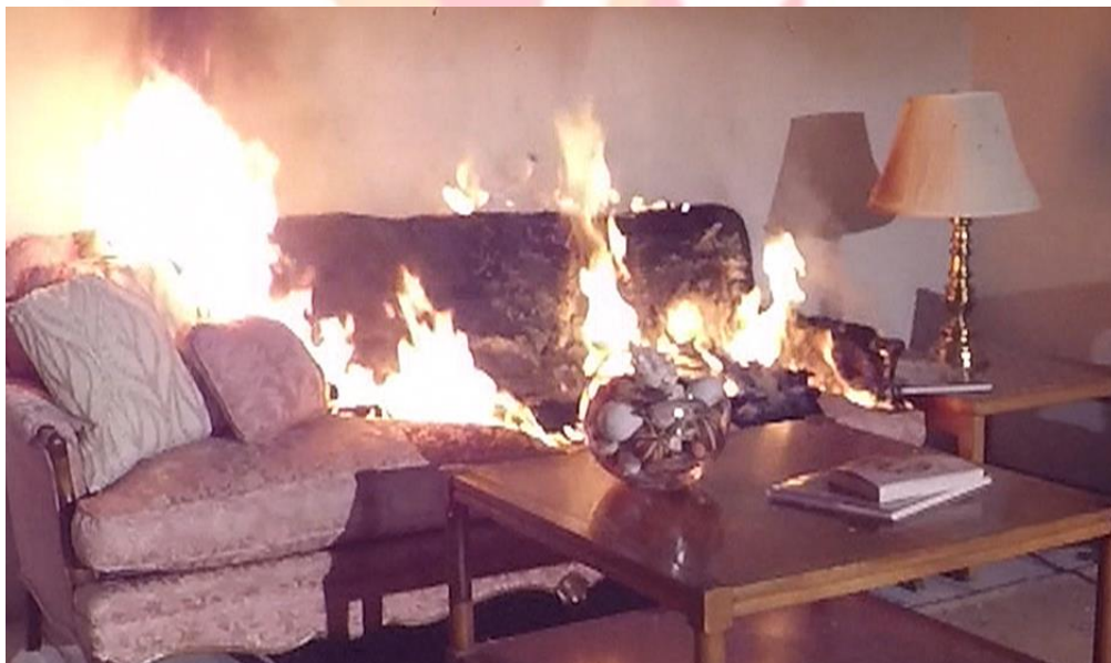
6. kép Bútor égése.

Szilárd anyagok (bútorok, szőnyegek, textíliák, stb.) égésénél (6. kép) használhatunk vizet, vagy porral oltó készüléket is.