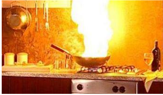
4. kép Konyhai olajtűz.

Amennyiben tűz az edényből továbbterjedt a konyhabútorra, azt a tűzoltókészülékkel oltjuk el.